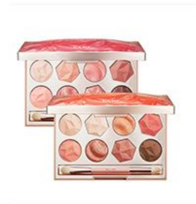
Prism Air Eye Palette