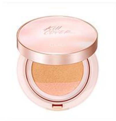
Kill Cover Pink Glow Cream Cushion