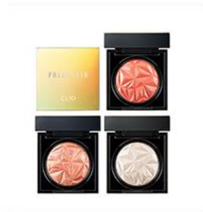
Prism Air Shadow Sparkling