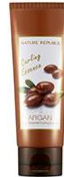
Argan Essential Curling Essence