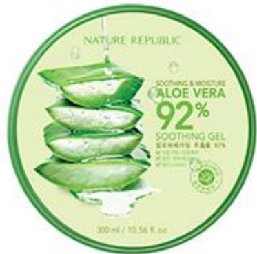
Soothing & Moisture Aloe Vera 92% Soothing Gel