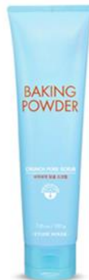
伊蒂之屋深层清洁磨砂洗颜粉 (管装)