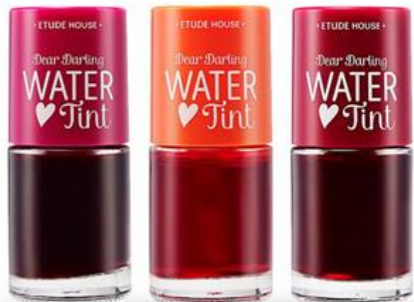
伊蒂之屋亲密爱人唇釉

GNE Global株式会社在多个品牌当中， Etude house, Nature republic, Missha, Skin food, Pondang, W-Dress room Y-COS 通用的品牌总部交易， 以稳定合理的价格进行供货。另外，经过协商后，也有部分商品和相关品牌进行独家供货。