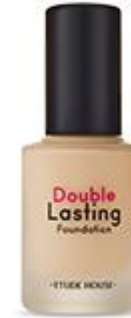
Double Lasting Foundation