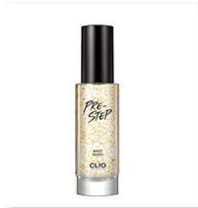
Pre-step Moist Primer