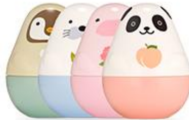
Missing U Hand Cream