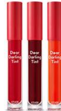
Dear Darling Tint