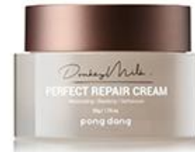
Donkey Milk Perfect Repair Cream