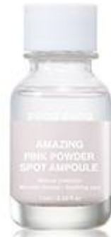
Amazing Pink Powder Spot Ampoule