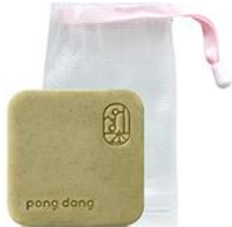
Derma Clinic Pure Cleansing Bar