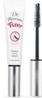
Dr. Mascara Fixer for Perfect Lash