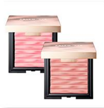
Prism Air Blusher