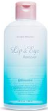
Lip & Eye Remover