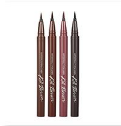
Waterproof Pen Liner