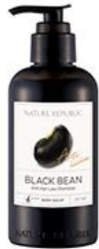
Black Bean Anti Hair Loss Shampoo