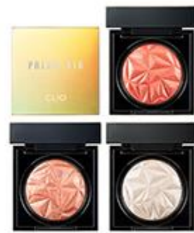
프리즘 에어 섀도우 스파클링