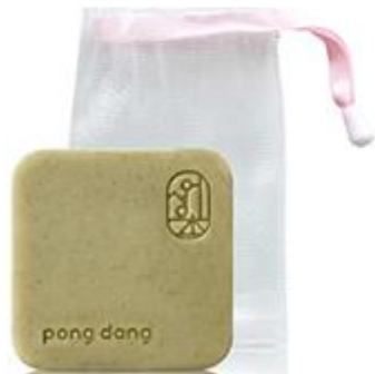
더마 클리닉 퓨어 클렌징 바