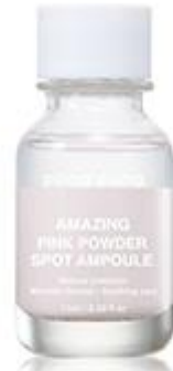
어메이징 핑크 파우더 스팟 앰플