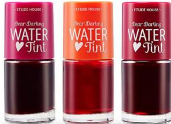
에뛰드 디어달링 워터틴트

주식회사 지앤이글로벌은 다양한 카테고리 중에서도 에뛰드, 네이처리퍼블릭, 미샤, 스킨푸드, 풍당, W드레스를 등 Y-COS로 통용되는 브랜드 본사 거래를 통하여 안정적이고 합리적인 가격으로 물건을 공급합니다. 또한 몇몇 상품은 해당 브랜드와 협의하에 독점 납품을 하고 있습니다.