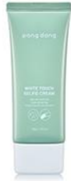
화이트 터치 셀카 크림