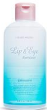
립 & 아이 리무버