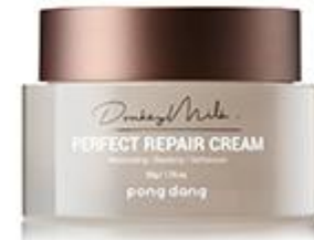
동키 밀크 퍼펙트 리에퍼 크림