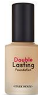
더블 래스팅 파운데이션