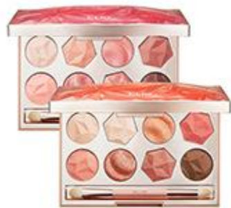
프리즘 에어 아이 팔레트