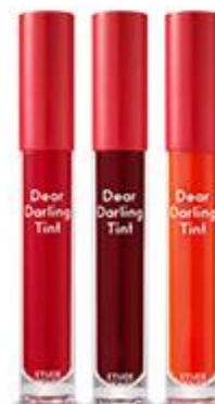
디어 달링 틴트