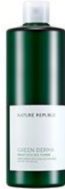
그린더마 마일드 시카 빅토너