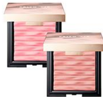
프리즘 에어 블러셔