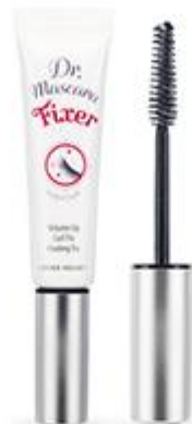
닥터마스카라 픽서 포 퍼펙트 래쉬