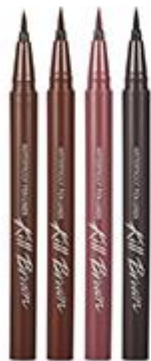
워터프루프 펜라이너 오리지널