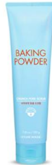
에뛰드 베이킹 파우더 사각사각 모공 스크럽 (튜브형)