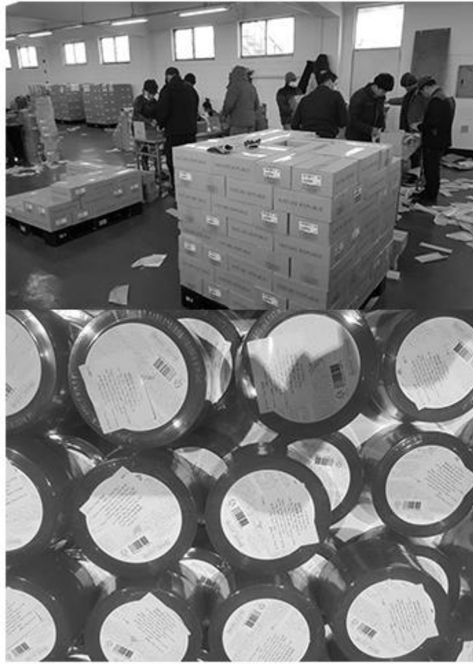
스티커 작업 및 수출에 필요한 작업 진행