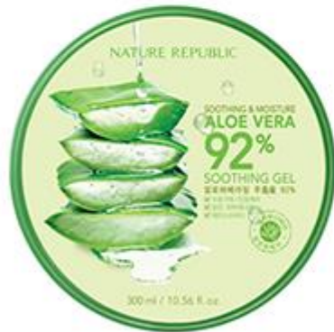
수딩 & 모이스처 알로에베라 92% 수딩젤