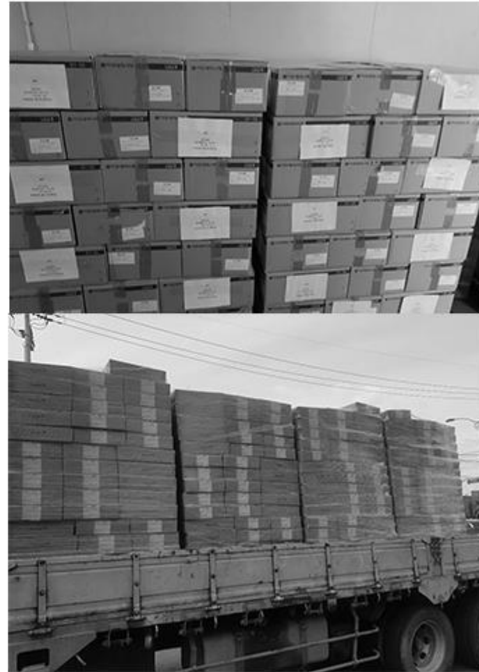
제품을 직접 포장 후 발송 진행