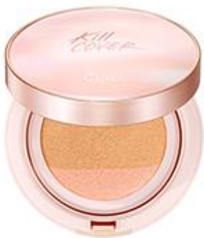
킬커버 핑크광채 크림 쿠션